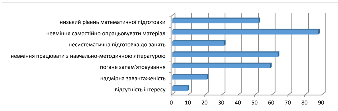
Рис. 1. Причини виникнення труднощів