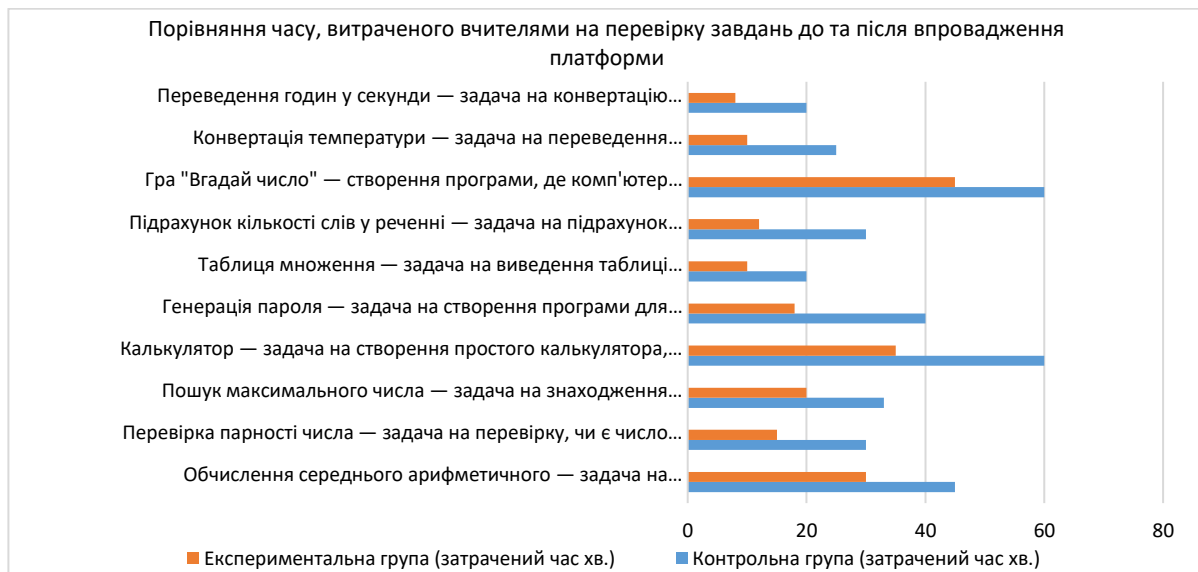
Рис. 5. Порівняння часу, витраченого вчителями на перевірку завдань до та після впровадження платформи.

На графіку (рис. 5) показано порівняння часу, витраченого вчителями на перевірку завдань до та після впровадження платформи, де видно значне скорочення витрат часу.