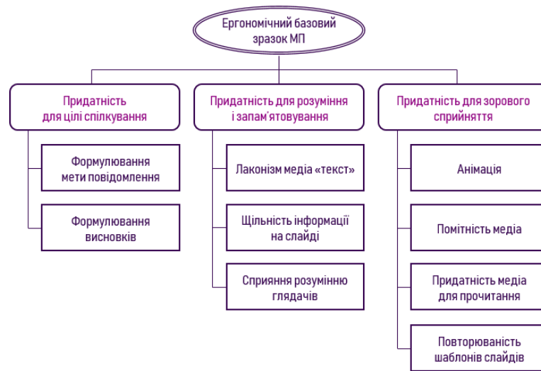
Рис. 2. Характеристики (■) та ознаки (■) ергономічного базового зразка для неінтерактивних мультимедійних презентацій (МП)

Вони втілюються у дев’яти спостережуваних ознаках, які підлягають безпосередній оцінці. Їх назви містить рис. 2.