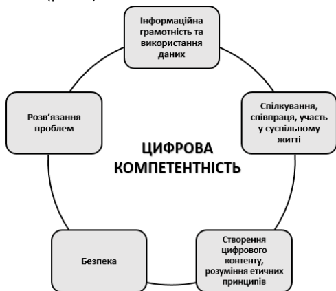
Рис. 1. Структура цифрової компетентності згідно «DigComp» (DigComp, 2016)

Дотримуючись існуючих фреймворків автори DiKoLAN framework (Kotzebue et al, 2021) описують цифрові компетентності учнів та вчителів, які є актуальними для розробки науково-педагогічних норм природничої освіти з цифровою підтримкою (рис. 2).