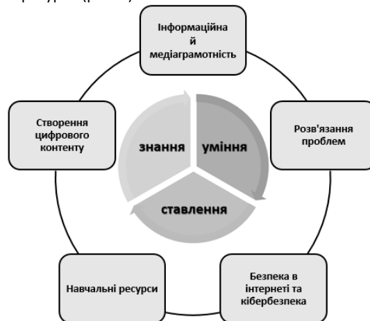
Рис. 4. Структурні компоненти ІЦК учня під час вивчення природничих наук

Таким чином, узагальнення вищезазначеного дало можливість визначити структуру та сферу застосування ІЦК здобувачів освіти під час вивчення природничих наук. Виявлено, що це поняття включає: інформаційну й медіа грамотність, знання про безпеку роботи в інтернеті та кібербезпеку, вміння створювати цифровий контент, вміння розв'язувати проблеми та навчальні ресурси (рис. 4).