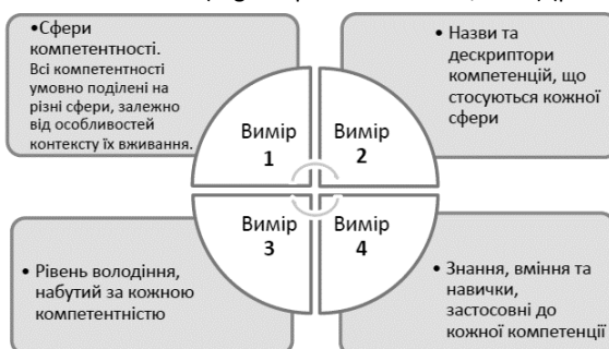
Рис. 3. Блок-схема адаптованої до України Рамки цифрової компетентності (DigComp UA for Citizens, 2021)

Аналіз світового та європейського досвіду формування цифрової компетентності громадян, а також чинних нормативних документів прийнятих у Європейському союзі та UNESCO (Куйбіда, 2020) спонукали до створення для громадян України Рамки цифрової компетентності (DigComp UA for Citizens, 2021) (рис.3).